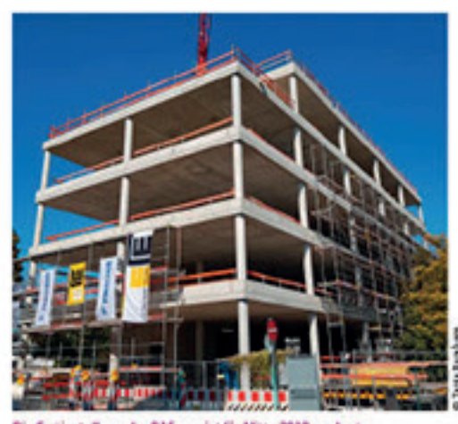
Die Fertigstellung der D15 neo ist für Mitte 2019 geplant.

Derzeit ist einiges in Bewegung an den verschiedenen Fresenius-Standorten in Bad Homburg. Die ersten Umzüge im Bereich Fresenius Medical Care sind bereits abgeschlossen, die Fertigstellung des Forschungs- und Entwicklungsgebäudes der Fresenius Medical Care D15 neo ist für Mitte des kommenden Jahres geplant und in unmittelbarer Nähe sind die Bauarbeiten der EK3 zur Erweiterung der Konzernzentrale weiter in vollem Gange. Die Kolleginnen und Kollegen der Fresenius Medical Care aus den Gebäuden der Siemensstraße 15 und 21 haben zwischen August und September ihren Arbeitsplatz in die Marienbader Höfe in Bad Homburg verlegt. Nicht nur der neue Standort, auch das geänderte Raumkonzept bedeutet dort für alle Mitarbeiterinnen und Mitarbeiter eine deutliche Umstellung. Bei dem Begriff Großraumbüro entsteht im Kopf oft das Bild eines Callcenters, in dem es laut, hektisch und unruhig ist. In den Marienbader Höfen wurde ein spezielles Konzept –