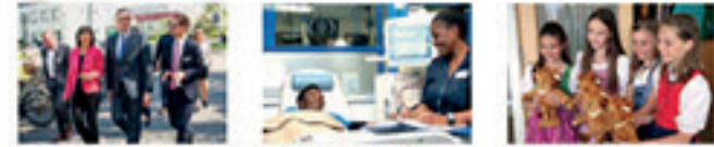
LEBENSWERK BLEIBT IN ERINNERUNG 50 FRESENIUS JAHRE Minister diskutiert mit Mitarbeitern über Situation der Pflege Seite 4 RECHENWEISE Wie Fresenius Medical Care in Afrika Planarbeitsplätze der Behandlung November 2018 Seite 7 STÄRKE MIT E. COCCO Fresenius Nephrologist Elmerio, die Nephrologen ihrer Kinder an Seite 9

Die Zeitung für die Mitarbeiterinnen und Mitarbeiter des Fresenius-Konzerns