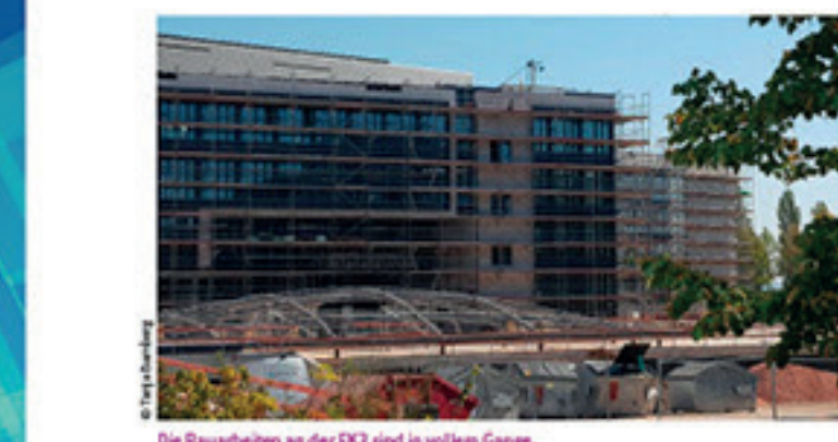
Die Bauarbeiten an der EK3 sind in vollem Gange.

Open Space – umgesetzt, welches versucht, diesem Bild entgegenzuwirken. Anders als bei dem derzeit neu entstehenden Gebäude EK 3 in der Else-Kröner-Straße muss man hier allerdings mit den vorhandenen Gegebenheiten arbeiten. Dies erscheint nicht immer ganz einfach. Daher legen wir als Betriebsrat in der Zusammenarbeit mit der Abteilung Arbeitssicherheit hier auch ein besonderes Augenmerk auf die Umsetzung und Weiterentwicklung des Konzeptes sowie die Einhaltung der Arbeitsstättenverordnung. Der Arbeitgeber ist verpflichtet, uns umfassend über die